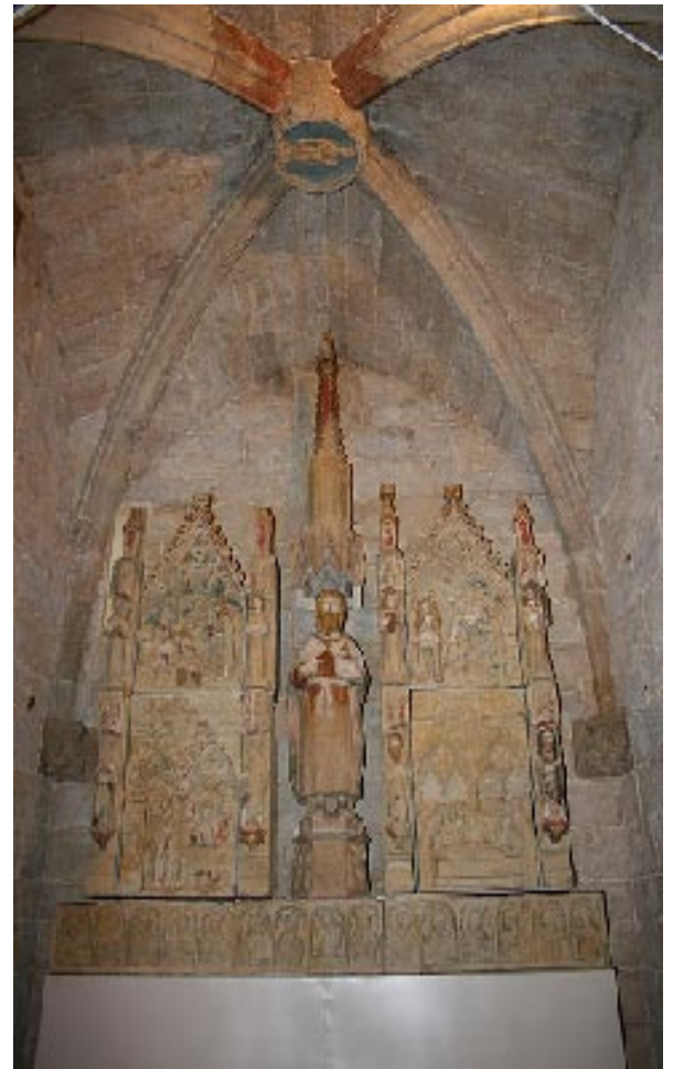
Imatge completa del retaule