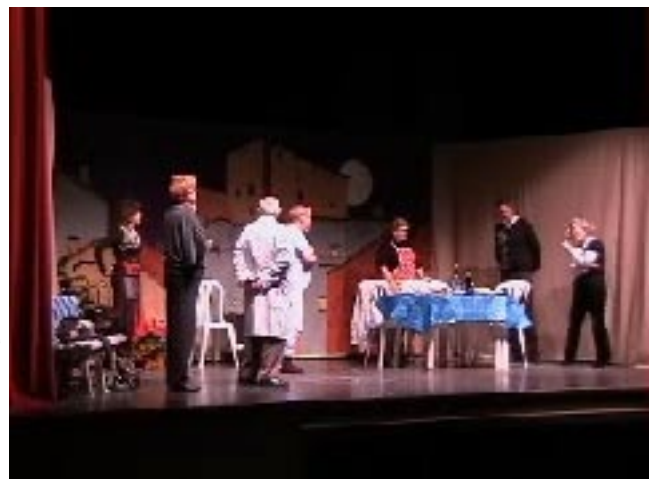
Fotografia d'una de les escenes de l'obra "No ho diguis a ningú"

Totes aquestes actuacions estan incloses dins les Vesprades Teatrals del Consell Comarcal, però a més a més, ens fa especial il·lusió la prevista pel dia 21 de desembre, que es representarà pels avis/àvies del centre RESIDENCIAL SANT SEBASTIÀ d'Alcarràs.