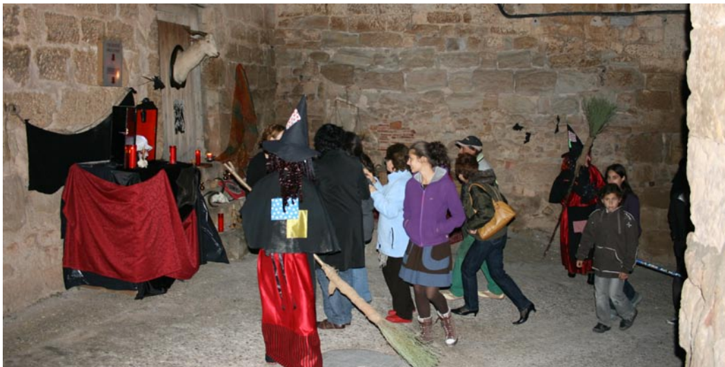
Torrebesses es converteix en un passatge del terror per celebrar la Castanyada i Tots Sants

Amb la participació de totes les associacions del poble i esperem que sigui també amb la col·laboració de tots els veïns