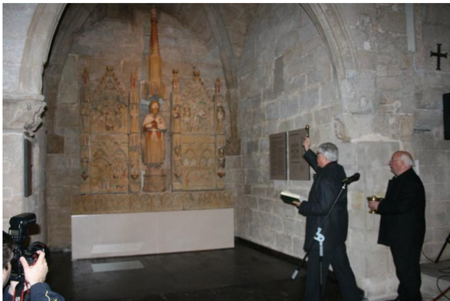
Moment de la benedicció del retaule a càrrec del Bisbe Joan Piris