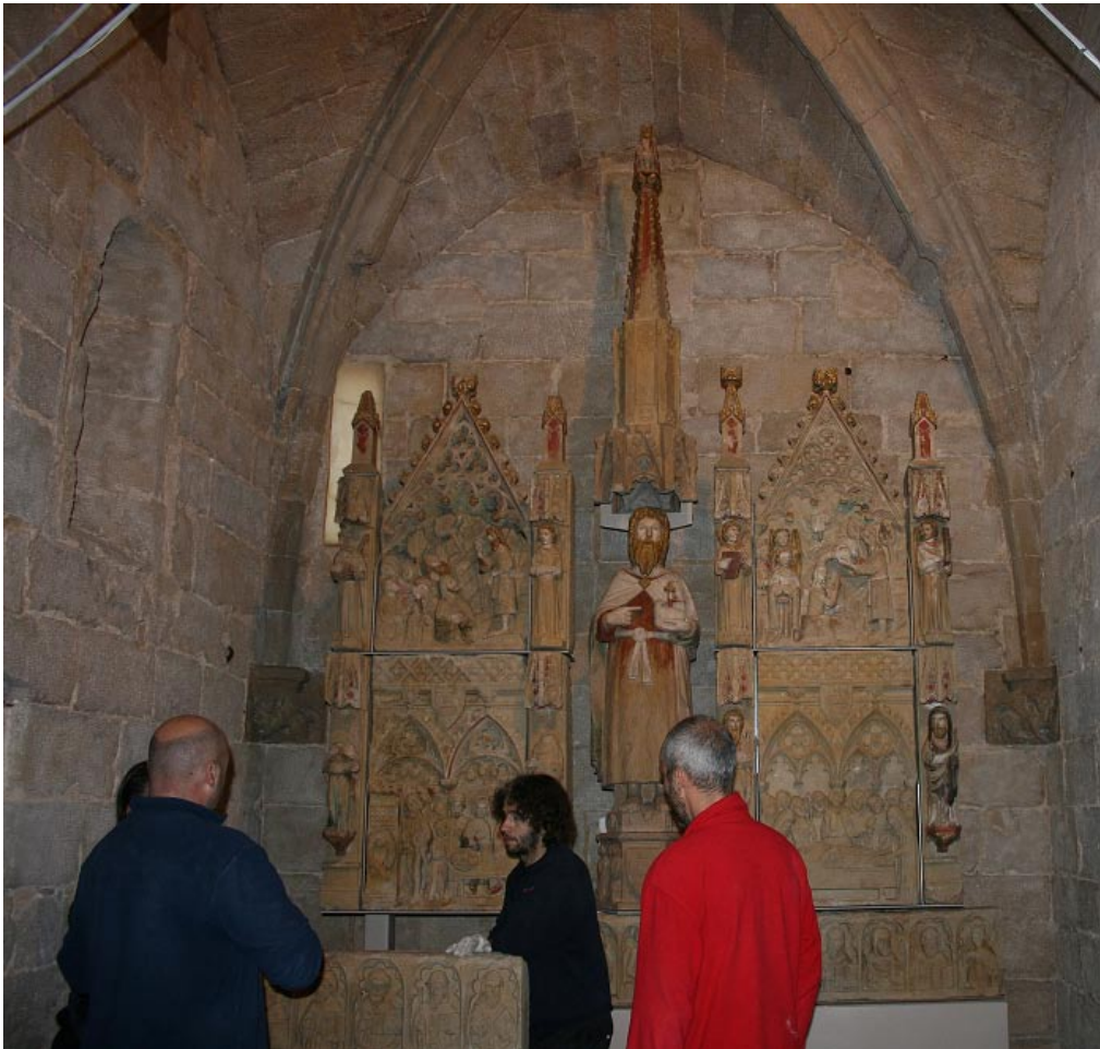
Imatge dels treballs de col·locació del retaule de Sant Joan

El treball de restauració i conservació de la pedra i la policromia demostren que es tracta d'un dels millors retaules del segle XIV a la província fet per l'escola de Lleida