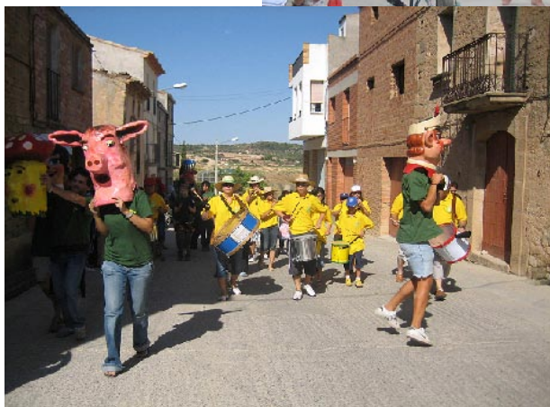
Fotos de la Festa Major de Sant Salvador 07