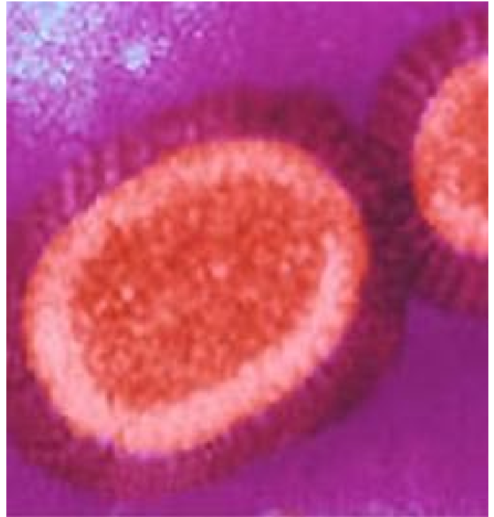
Imatge del virus del Papil·loma Humà