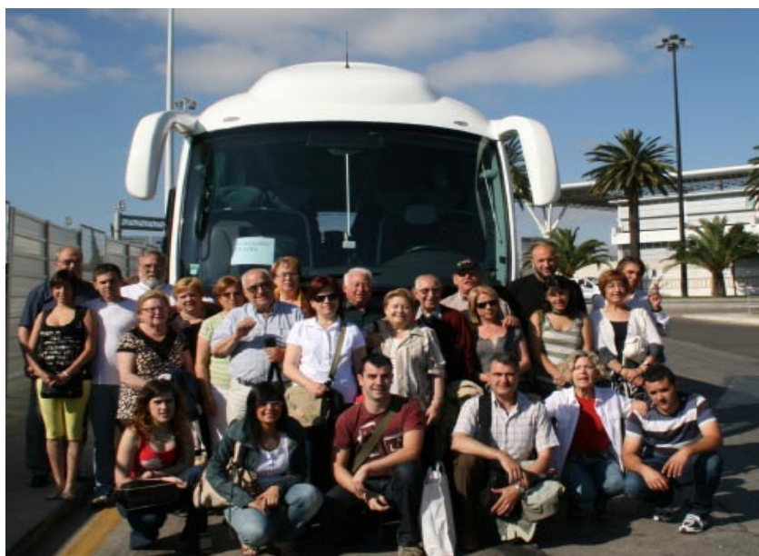
El grup de teatre TorreBesses Activa a Portugal