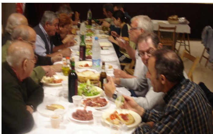
Sopar dels jugadors del torneig de botifarra

Però el torneig de botifarra realment finalitzà amb el sopar de germanor que es va fer per compartir el premi.