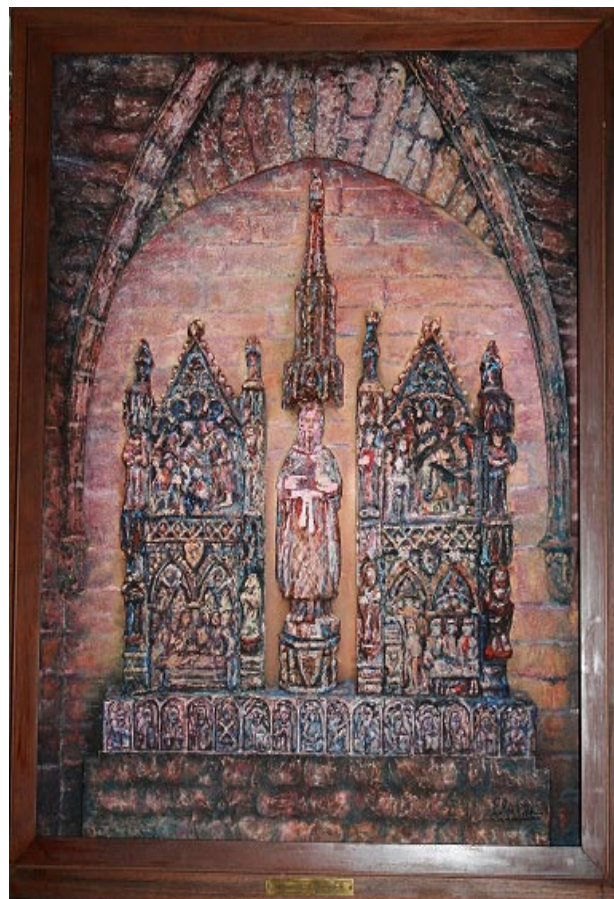
Quadre del retaule de Sant Joan

Durant aquests dies s'ha publicat als mitjans de comunicació que els alcaldes de poblacions menors de 2.000 habitants cobrarien un sou a càrrec de la Generalitat. Des d'aquestes línies voldríem informar que per rebre el cent per cent del sou cal tenir dedicació exclusiva, i a més cal que l'Ajuntament es faci càrrec de les despeses de la Seguretat Social. Fent una primera aproximació això suposa uns 400 euros mensuals. Des de l'Ajuntament creiem que en aquests moments aquesta despesa seria una càrrega excessiva per a l'economia municipal i, per tant, no ens acollirem a aquesta ajuda i l'alcalde i els regidors continuarem sense cobrar.