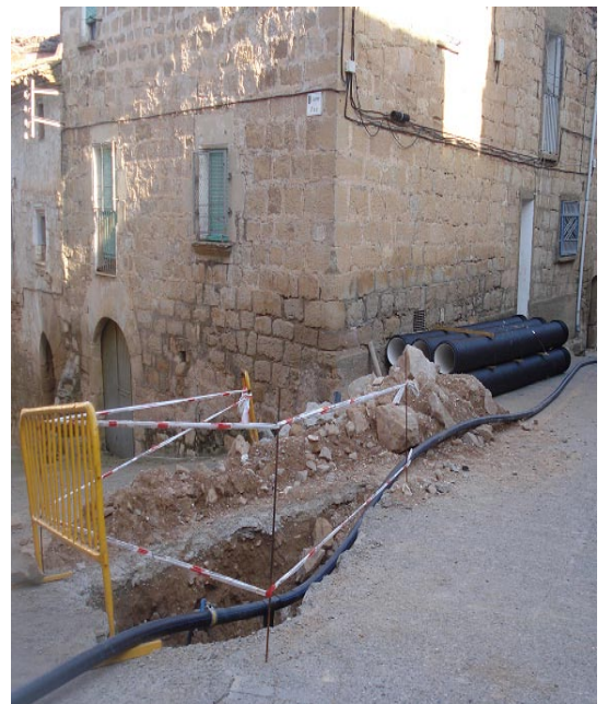
Carrer tallat per les obres

A les acaballes del mes d'abril, l'Ajuntament va iniciar la primera fase de les obres per tal de renovar la xarxa de clavegueram que abasteix el nostre municipi. En aquesta primera fase s'ha aixecat tota la zona nord del poble, amb la qual cosa alguns carrers han estat tallats a la circulació de vehicles de quatre rodes. A mesura que aquestes reformes vagin avançant, s'aniran obrint altres carrers per tal de canviar les tuberies que compten amb més de 50 anys.