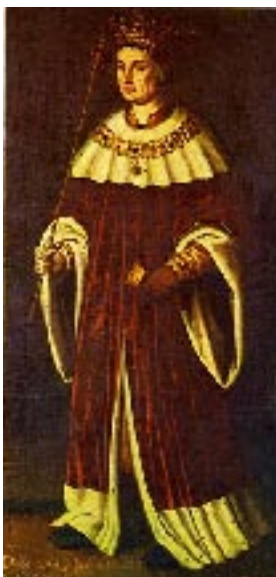
Imatge de Joan II

Corria l'any 1461, quan el rei Joan II el Gran i el seu fill Carles de Viana, van iniciar una lluita pel poder de la Corona Catalanoaragonesa. El rei Joan no era ben vist pel govern de la Generalitat i es declarà la que fou la Primera Guerra Civil Catalana.