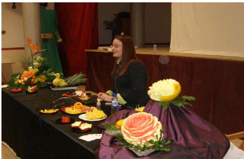
Demostració del taller de fruita