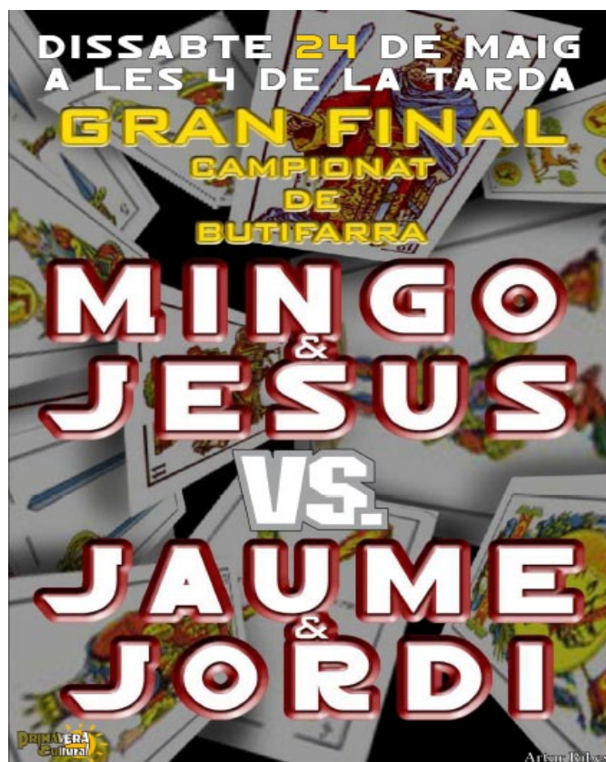
Cartell de la gran final