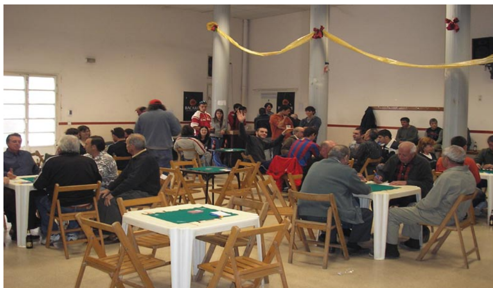
Primera partida del torneig de botifarra.