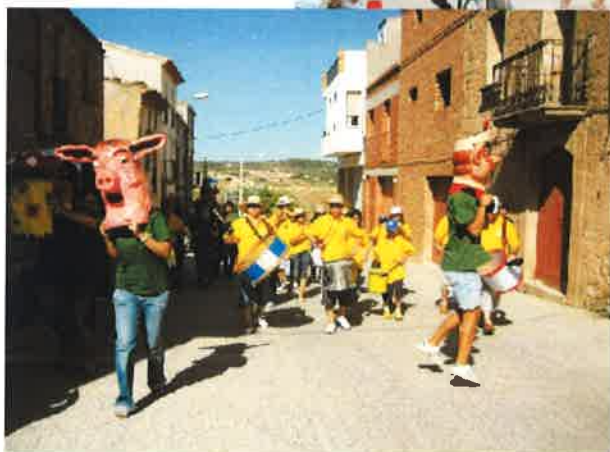
Fotos de la Festa Major de Sant Salvador 07