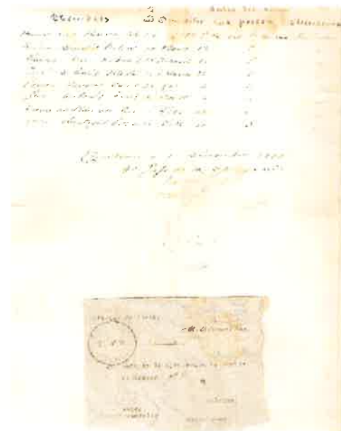
Llista de voluntaris de l'Associació "Acción Ciudadana"

Ara fa 73 anys, concretament el dia 13 de desembre de l'any 1934 es féu una de les moltes llistes que durant els anys anteriors a la guerra civil i a la postguerra es feren a partir de gent dels municipis que s'oferien voluntaris a realitzar un servei de guàrdia i custòdia dels nostres conciutadans avantpassats. Aquests es feien anomenar "Agrupación de la Acción Ciudadana". En la llista hi constava el nom, la edat, el domicili, les senyals de la seva arma i alguna observació.