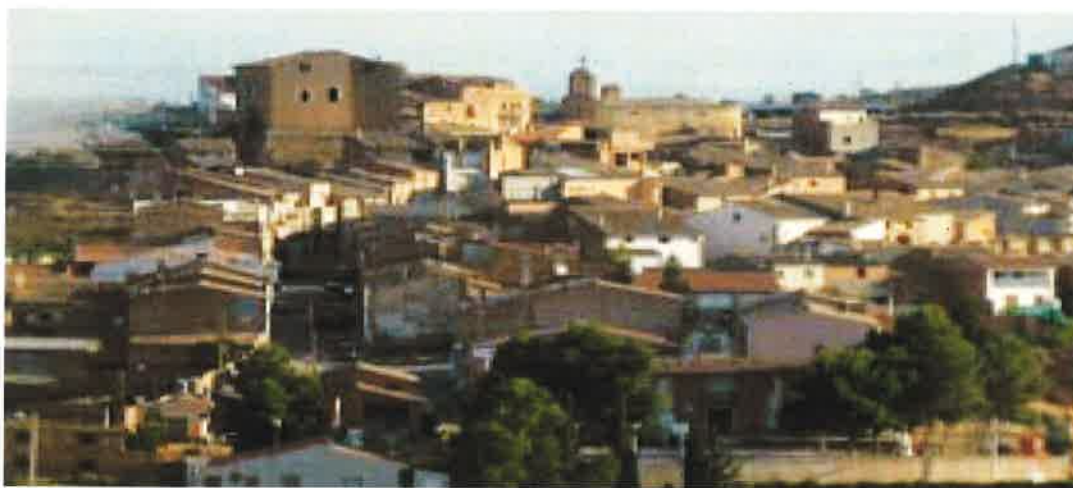
Vista panoràmica del poble de Torrebesses

Neix a Torrebesses una publicació periòdica amb la participació de tot el poble