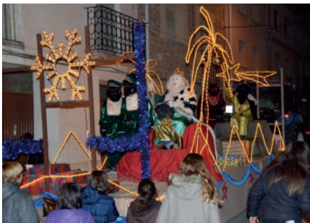
Arribada dels Reis Mags d'Orient. Gener