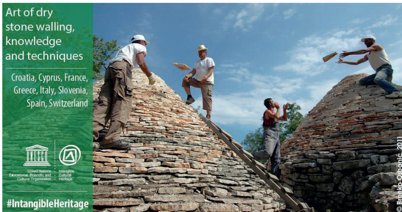
Declaració de la tècnica de la pedra seca com a patrimoni immaterial de la humanitat de la UNESCO, novembre 2018.

Aquest 2018 ha estat un any especial pel Centre d'Interpretació de la Pedra Seca i Torrebesses. Com ja sabeu, el 28 de novembre la UNESCO va declarar la tècnica de la pedra seca com a patrimoni immaterial de la humanitat sota el nom oficial "L'Art de la pedra seca: coneixements i tècniques". Aquest és un reconeixement per la bona feina feta per molta gent, que ha posat en rellevància la tècnica i les construccions de la pedra seca fins a aconseguir la declaració com a patrimoni de la humanitat.