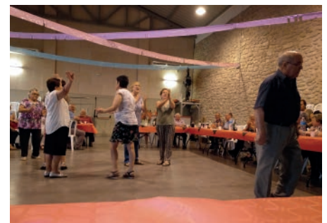
Festa de la Llar de Jubilats Sant Roc. Agost.