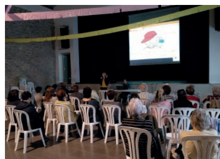
Xerrada AFANOC, Primavera Cultural