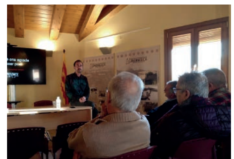
Torrebesses Tremola. Octubre