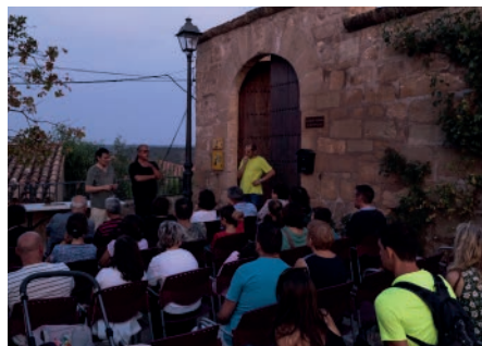
3a edició de la Nit d'Estels de Torrebesses, agost 2018.

La nostra tasca de difusió continua amb la presència del CIPS en fires (com les de Maials, Tàrrega, Mora la Nova, Borges, entre d'altres) i en les xarxes socials, consolidant-se amb l'aparició de Torrebesses en premsa i televisió en múltiples ocasions, des de notícies fins a programes de turisme. Hem de destacar també l'ingrés de Torrebesses com a municipi associat a la Xarxa de Turisme Industrial de Catalunya.