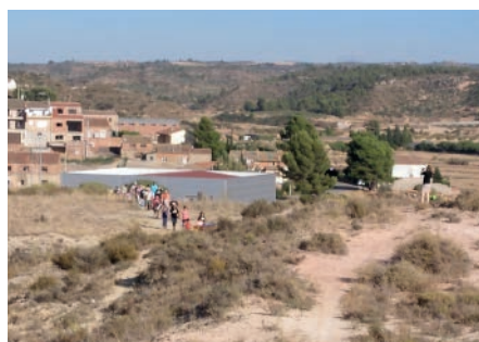
Celebració 1-O. Octubre