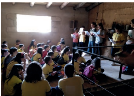
Descoberta de l'Entorn De Zer l'Eral. Maig