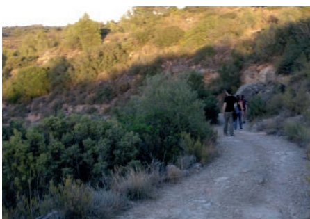
Setmana de la mobilitat. Setembre