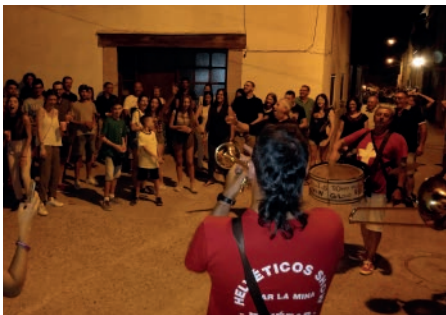
Corre-bars amb txaranga. Festa Major Sant Salvador.