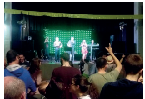
Ball de la Festa de les Dones. Març