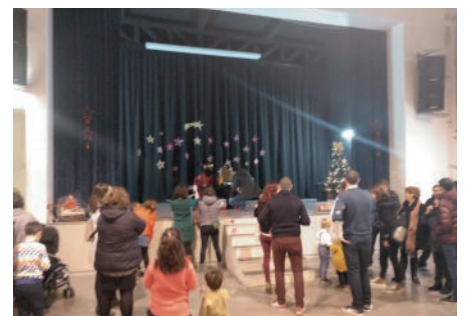
Arribada del Xambelan. Desembre.