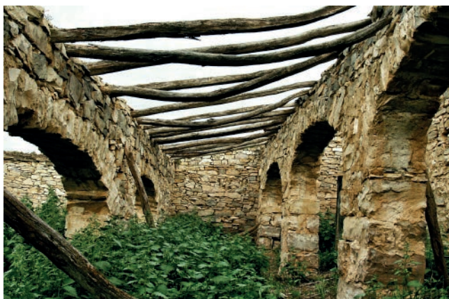
1r premi 2018 - El corral dels arcs Autor: Àngels Mercadé Roca