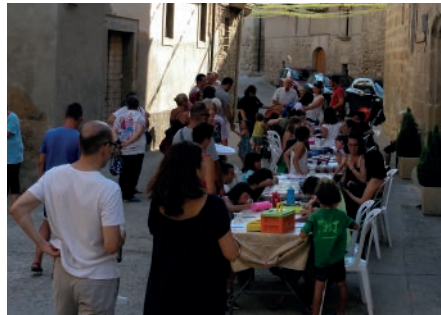
Concurs de dibuix de Casa Gort. Festa Major Sant Salvador