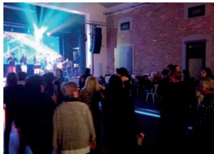
Ball de Festa Major Sant Sebastià. Gener