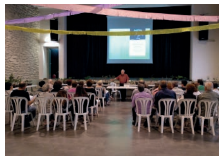
Xerrada sobre l'art de cultivar bonsais a càrrec de Lumbierres. Primavera Cultural