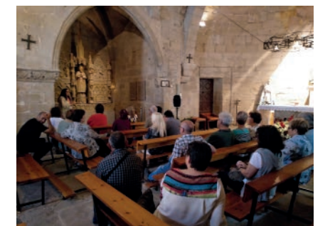
Visita guiada al retaule de Sant Joan de l'Església de Sant Salvador. Juny