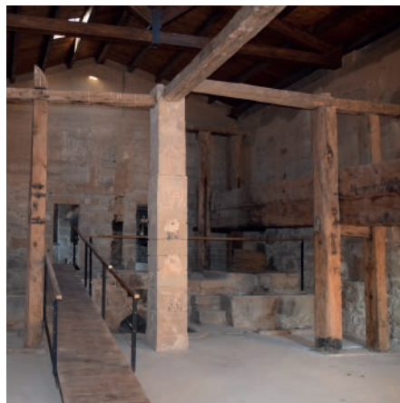
Molí del Bep de Canut.

suspensió de llicències municipals de parcel·lació, edificació o enderrocament de la zona en qüestió, excepte si el departament de Cultura ho autoritza al no ser obres que perjudiquin els valors que cal protegir.