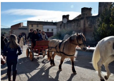
3 Tombs. Camins d'or líquid. Desembre