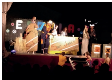
Escala Hi-fi . Festa Major Sant Salvador.