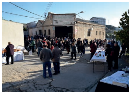
Camins d'or líquid. Desembre