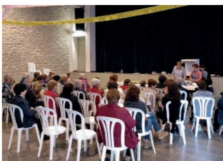
Taller de cuina dels Jubilats. Primavera Cultural