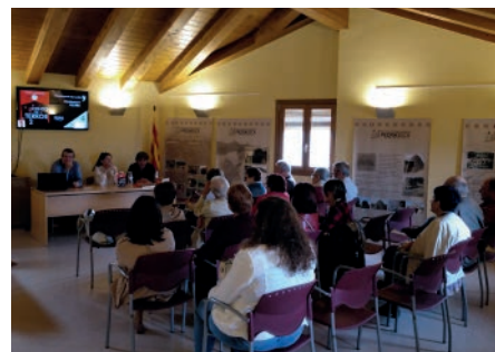
Presentació del llibre Contes de Terror 2 . Primavera Cultural.