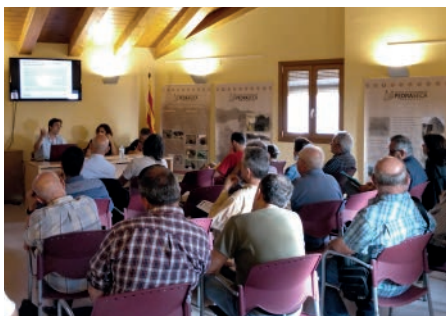
Xerrada: Nous usos de construccions de pedra seca . Primavera Cultural