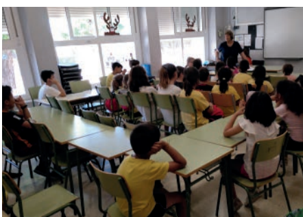
Visita dels nens i nenes al poble de Bot. Juny