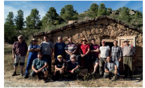
Curs de la Universitat d'Estiu "El Treball de la Pedra: Teoria i pràctica", juny 2018

Comença un any que estarà marcat per la declaració de la pedra seca com patrimoni de la humanitat, per la qual cosa esperem que Torrebesses sigui encara més visible en el mapa turístic de les Terres de Lleida perquè, tant el turisme de proximitat com el de la resta, descobreixi el nostre patrimoni i gaudeixi dels tresors de la Pedra Seca.