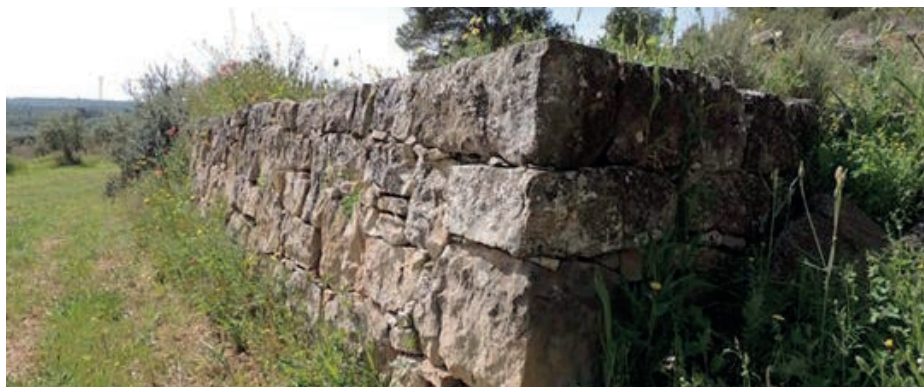
Marge de pedra seca.

Durant l'any 2018 l'ajuntament ha executat diverses obres pel poble com la construcció de nínxols, l'asfaltat de dos trams de camins: el que porta als dipòsits o camí