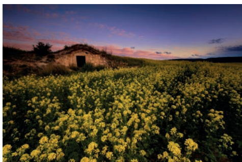
2n premi 2018 - Catifa daurada Autor: Jorge Lázaro Alfonso