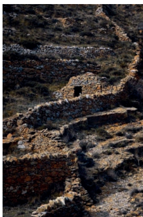
3r premi 2018 - Irregular Autor: Manolo Moliner Martín