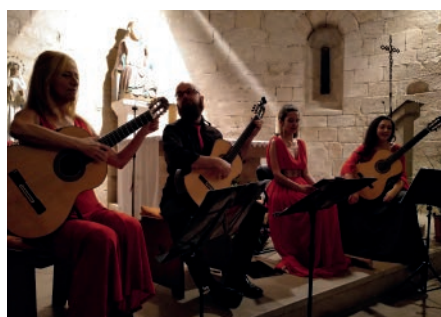
Simpòsium Pujol. Concert de 22Strings Quartet. Juliol