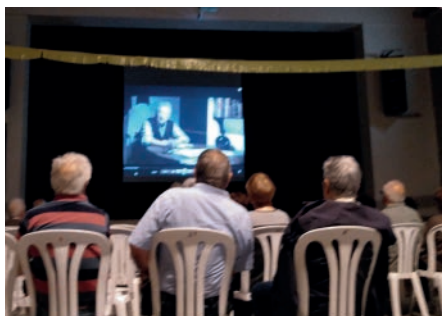
Presentació documental sobre Emili Pujol. Primavera Cultural