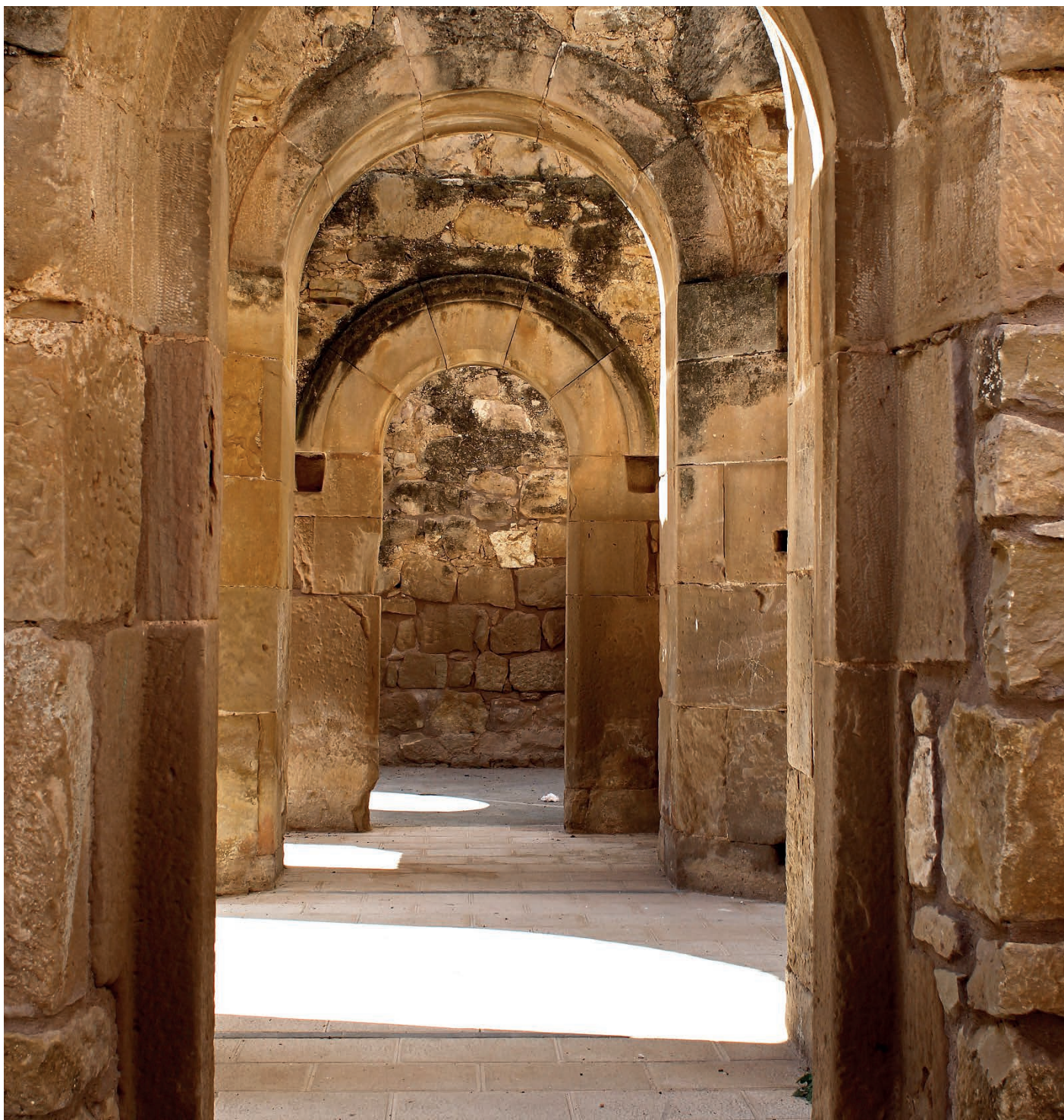
Premi Local 2014. Pedra artística a Torrebesses