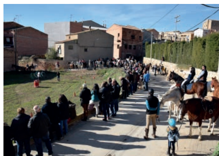
3 Tombs. Camins d'or líquid. Desembre