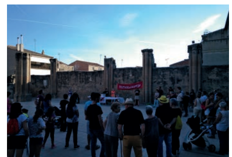
Celebració 1-O. Octubre