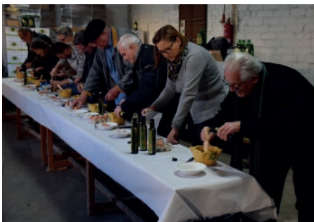
Concurs d'allioli. Camins d'or líquid. Desembre