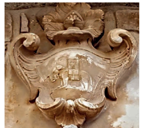
Escut de Casa Gort

Al poble es pot gaudir d'altres llinxes de pedra guarnides amb escuts espectaculars, com la que destaca al carrer del museu, que representa un sagrat cor amb dues creus templeres i un parell de canelobres, amb la data de 1699, i també gravats senzills com el d'una petxina, en una casa propera, amb la data 1652, que podria indicar que formava part d'alguna ruta de pelegrinatge.