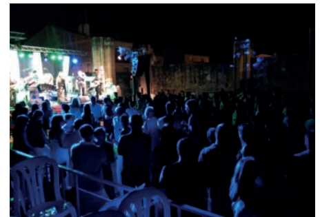
Ball de nit amb l'orquestra Marinada. Festa Major Sant Salvador.