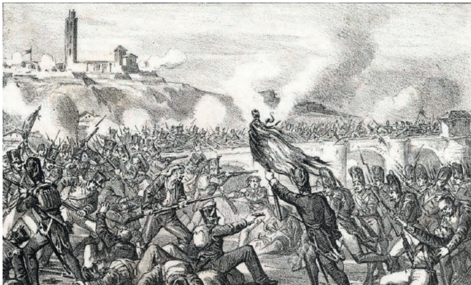
Defensa de Lleida el 13 de maig del 1810. Grabat del 1875

“La Junta de Lleida” coordinava la defensa dels pobles del les Garrigues, Pla d'Urgell i tots els pobles del voltant, ja que Barcelona estava en mans dels francesos,