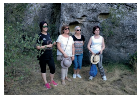
Simpòsium Pujol. Visita al Mas de Janet. Juliol