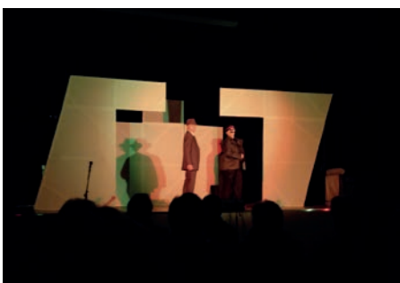
Segrià Teatre. Novembre.