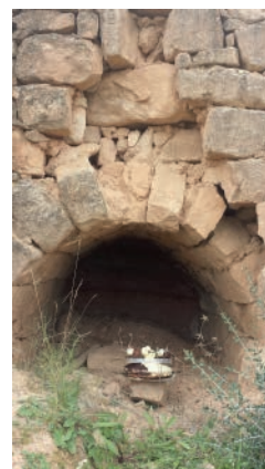
Vox populi 2018 - La cabana més dolça Autor: Marc Tomàs Olivares