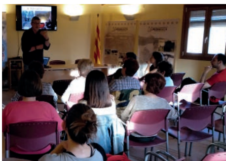
Xerrada: Com estar bé . Primavera Cultural