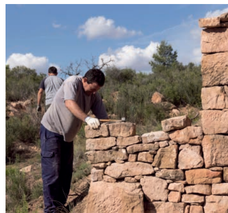
Curs de la Universitat d'Estiu "El Treball de la Pedra: Teoria i pràctica", juny 2018.