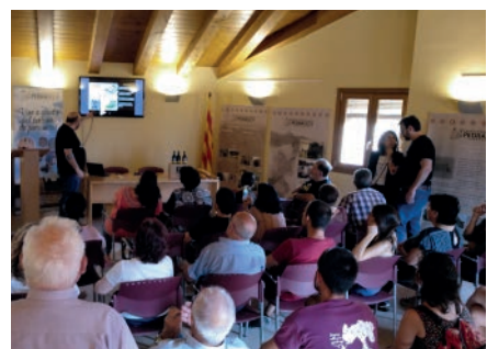
Benvinguts a Pagès. Primavera Cultural