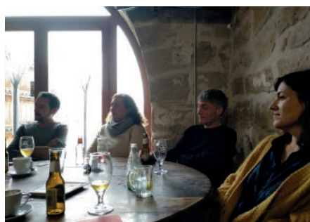
Torrebesses Tremola. Octubre