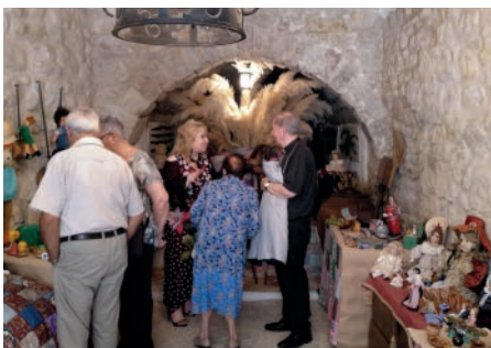
Exposició Joguines del segle passat . Festa Major Sant Salvador.