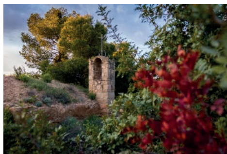
Premi local 2018 - Busca i trobaràs la llum Autor: Eugenia Sancho Martí