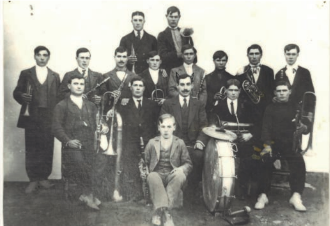
Banda musical, 1911