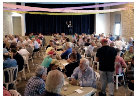
Campionat de Butifarra. Primavera Cultural