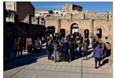
Tombs Creatius. Camins d'or líquid. Desembre.