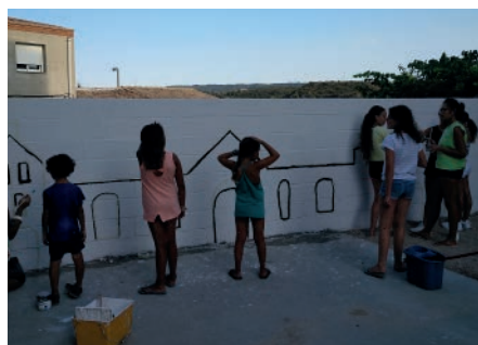
Pintada del Mural del Casal. Juliol