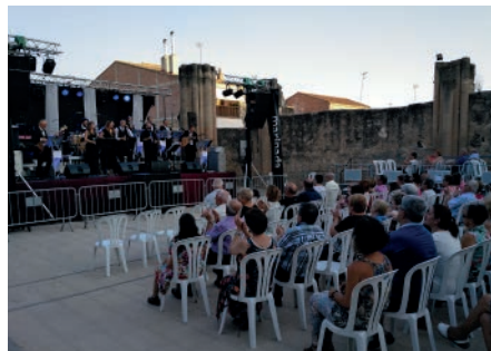
Concert amb l'orquestra Marinada. Festa Major Sant Salvador.