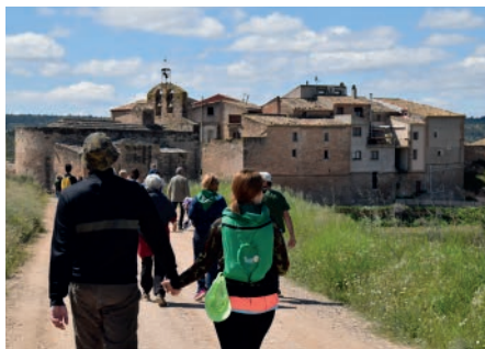
Caminada popular. Primavera Cultural