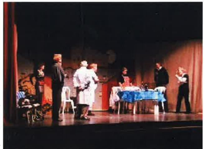
Fotografia d'una de les escenes de l'obra "No ho diguis a ningú"

Totes aquestes actuacions estan incloses dins les Vesprades Teatral del Consell Comarcal, però a més a més, ens fa especial il·lusió la prevista pel dia 21 de desembre, que es representarà pels avis/àvies del centre RESIDENCIAL SANT SEBASTIÀ d'Alcarràs.