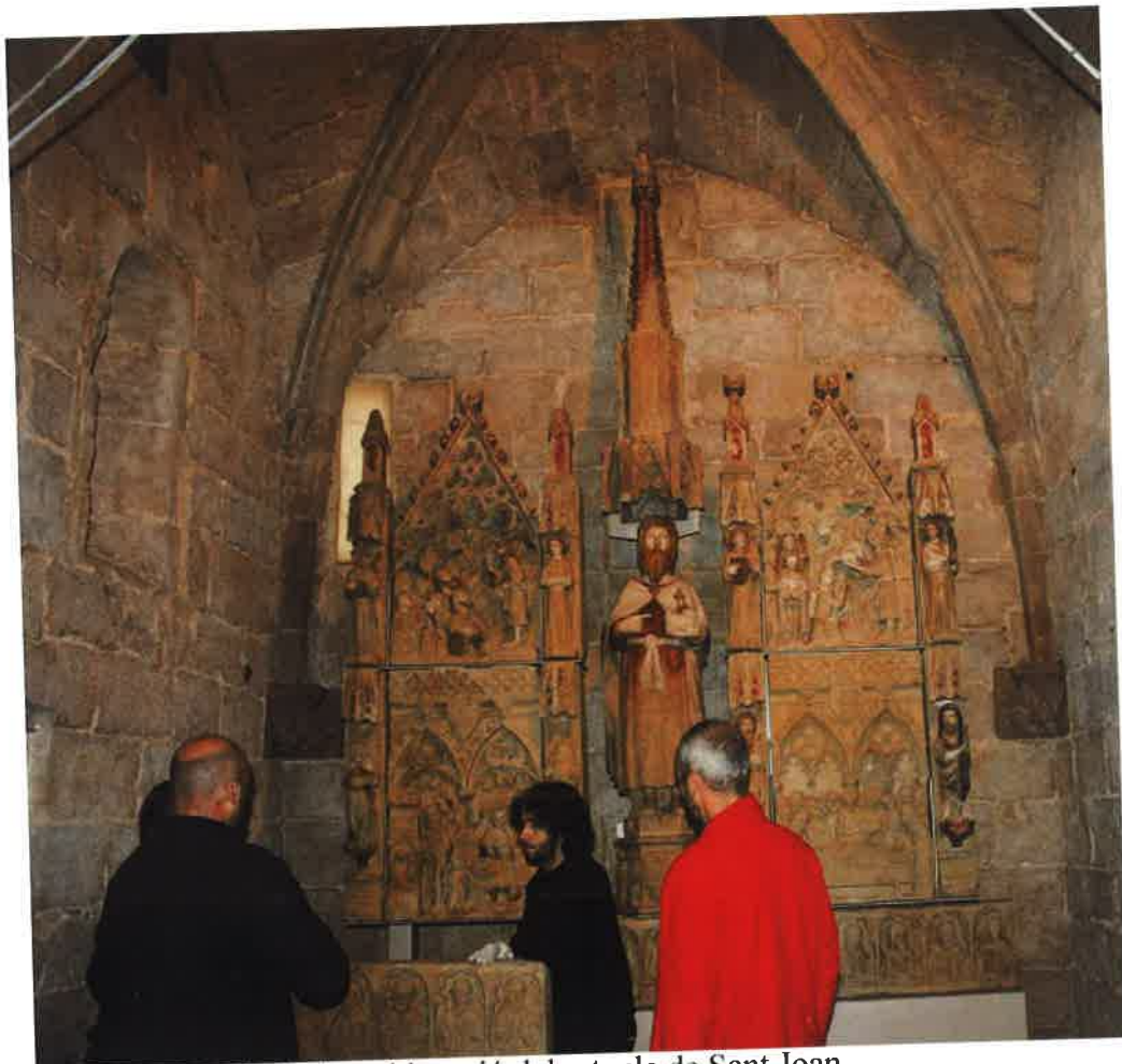
Imatge dels treballs de col·locació del retaule de Sant Joan

El treball de restauració i conservació de la pedra i la policromia demostren que es tracta d'un dels millors retaules del segle XIV a la província fet per l'escola de Lleida