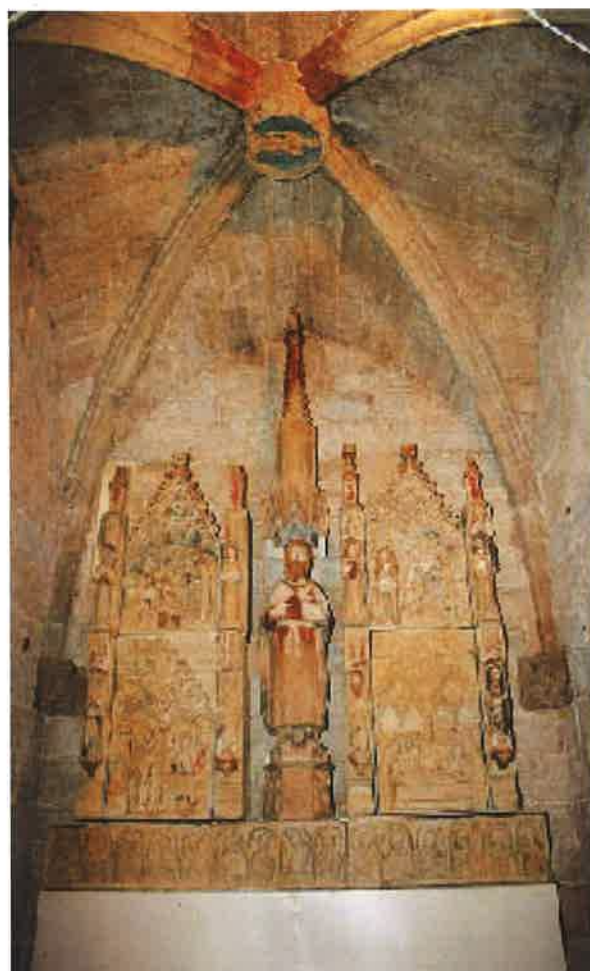
Imatge completa del retaule