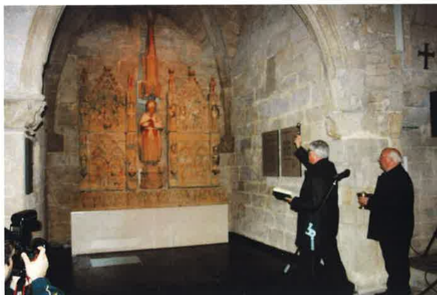
Moment de la benedicció del retaule a càrrec del Bisbe Joan Piris