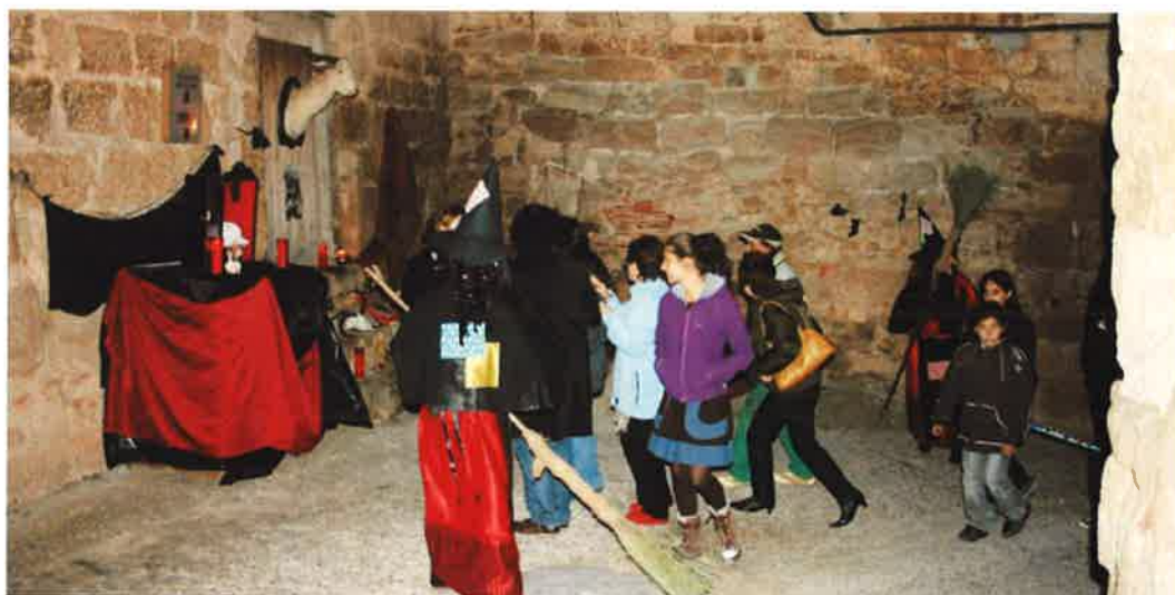
Torrebesses es converteix en un passatge del terror per celebrar la Castanyada i Tots Sants

Amb la participació de totes les associacions del poble i esperem que sigui també amb la col·laboració de tots els veïns