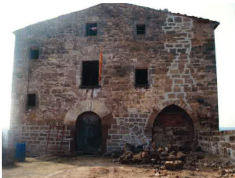
Façana en procés de rehabilitació

però va ser més la il·lusió que el seny el fet que m'impulsà a comprar el castell. És després quan t'adones que és un projecte de molta envergadura, i fa molt respecte.