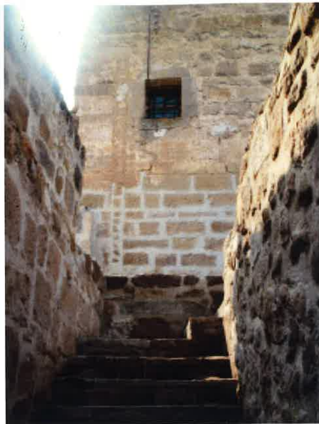
Escalles que porten al pati del castell

Em recorda molt al meu poble quan era petit. S'hi està molt a gust, és molt tranquil. És la tranquil·litat del poble que no ha perdut les seves arrels i que té molt de patrimoni. Disfruto moltíssim passejant amb amics i explicant-ne els detalls, com si fos el meu poble.