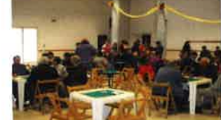
Primera partida del torneig de boliborrà.