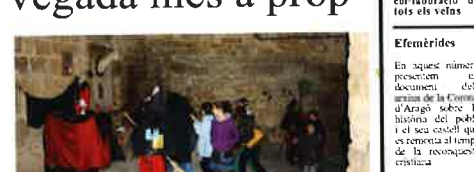
Torrebesses es converteix en un passeig del terra per celebrar la Castanyada i Tots Sants