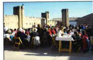
Foto del dinar de germanor de Festa Major de Sant Sebastià