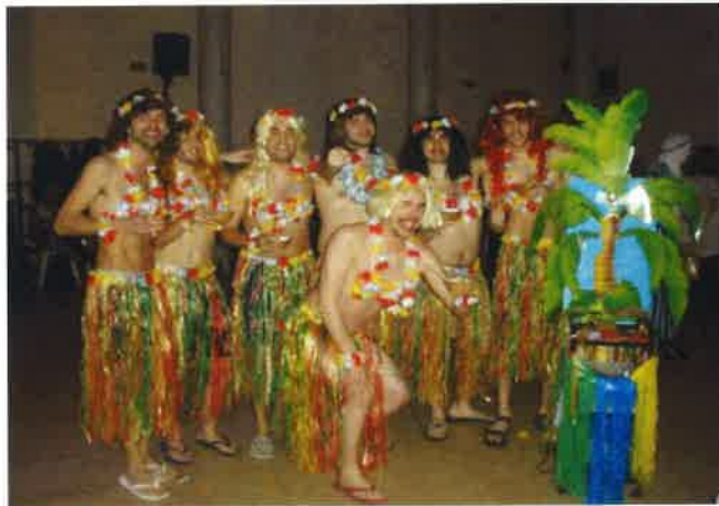
Festa de disfresses