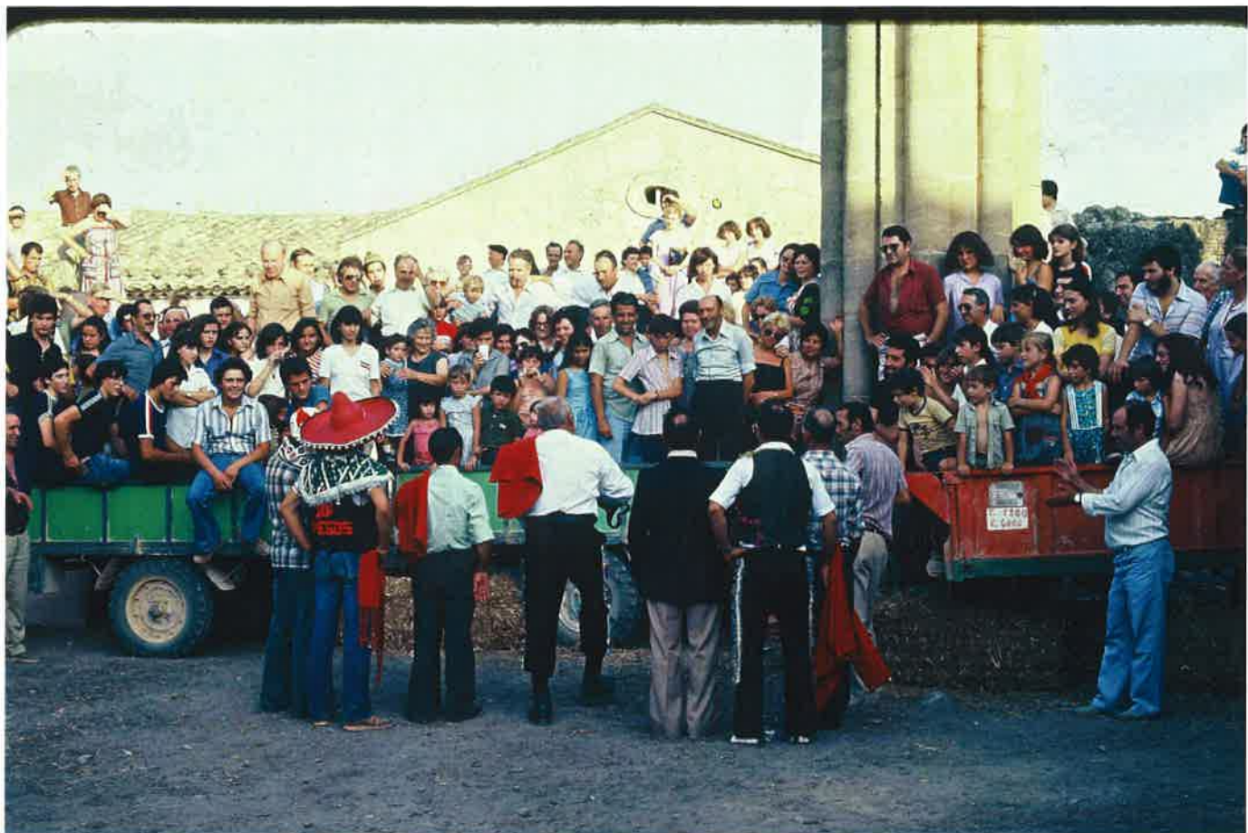
Anys 70, quan la llei antitaurina encara no existia i a Torrebesses es feien "novillades"