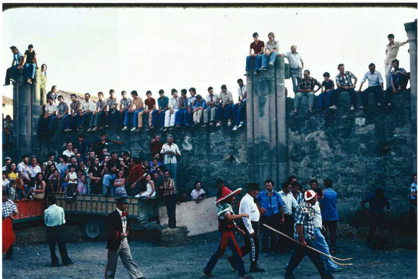
El Bollo de Torrebesses