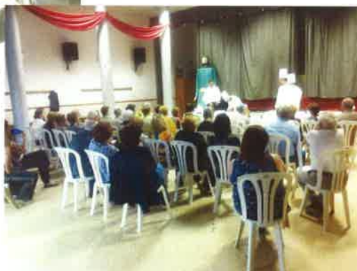
Taller de cuina

La llar de jubilats Sant Roc també va aportar el seu granet de sorra als actes celebrats durant la primavera cultural, i així el taller de cuina a càrrec de l'escola d'Hoteleria de Lleida i el concert audiovisual varen ser alguns dels actes que és van encarregar de coordinar. Com cada any també van commemorar la festa de Sant Roc com a patró dels jubilats.