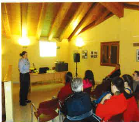
Xerrada mossos - mobilitat

Els joves amb totes les seves activitats ens fan passar bones estones. Cal dir que