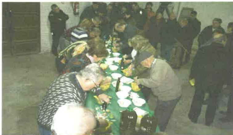
Concurs d'allioli 2012

Durant el aquest mes de desembre, ha passat per Torrebesses, la 4a edició dels Camins d'Or Líquid. Una jornada organitzada per la Cooperativa, amb col·laboració de l'Ajuntament i el suport del Consell Comarcal del Segrià, per tal de promocionar l'oli del nostre terme. Els actes que es van celebrar foren l'esmorzar popular, el tradicional concurs d'allioli i la inauguració de l'exposició al Centre de la Pedra Seca de "Kayart" del humorista gràfic Ermengol. En aquesta edició s'ha vist incrementat el volum de visitants i de firaires, tot per incentivar la venda del nostre oli.