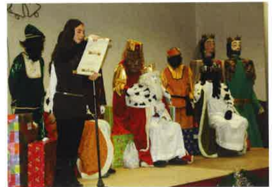
Arribada Reis Orient

Aquest curs els alumnes de cicle superior han constituït una petita empresa, Torreart , per tal que tots els nens i nenes poguessin aprendre el funcionament d'una organització