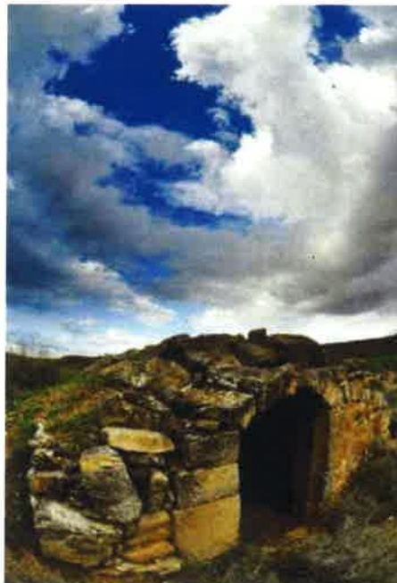
1r premi: "Mas de volta sota un núvol que s'abracen". Feta per David Estela

Són molts els actes que es fan durant l'any al nostre poble amb entusiasme i il·lusió per totes les associacions i entitats amb col·laboració de l'Ajuntament. Torrebesses es conegut tant per les festes com per les moltes activitats que es duen a terme, ara ens comencen a conèixer pel patrimoni que tenim, la pedra seca, però no hem de deixar de banda les activitats i la rica vida social del nostre poble. Aquesta publicació vol ser un element per consolidar i difondre tots aquests esdeveniments.