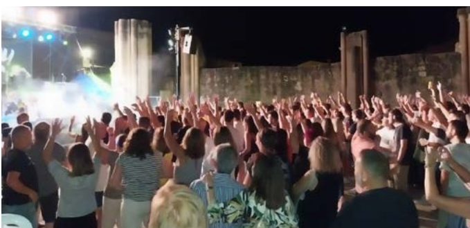
Nit de Festa Major. Festa Major Sant Salvador. Agost