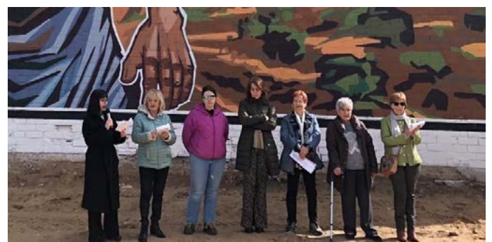
Lectura del manifest en motiu del Dia Internacional de les Dones. Març