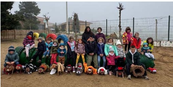
Arribada dels Troncs de Nadal. Desembre