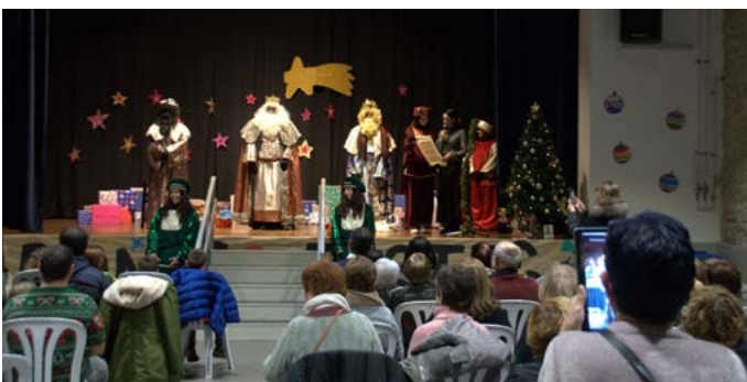
Arribada dels Reis Mags d'Orient. Gener