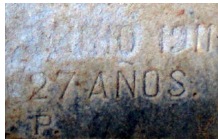
Detall de la làpida, on encara es pot llegir 2 junio 1911. 27 años.