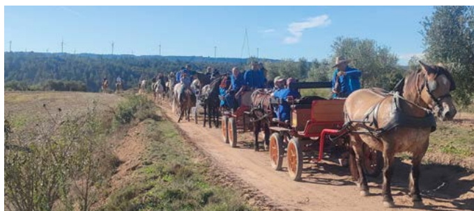
Els Tres Tombs. Octubre