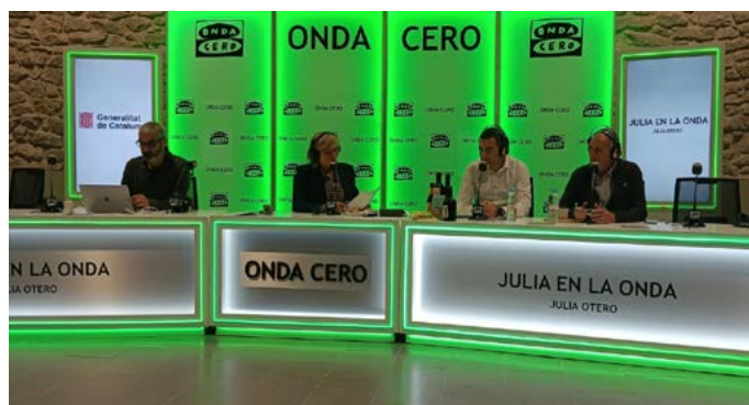
Júlia Otero fa el seu programa de radio, des de Torrebesses, dins del Projecte de la Diputació de Lleida "Poble petit, gran vida". Novembre