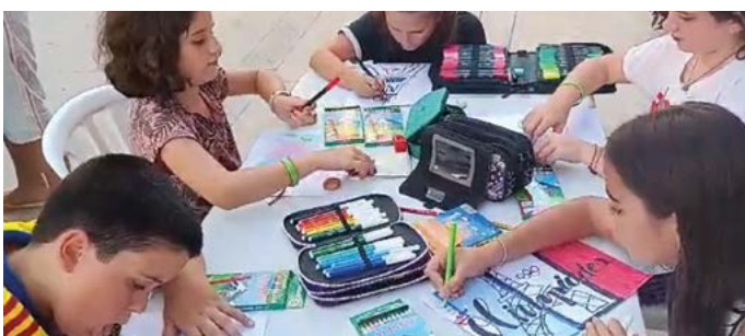
Dibuixem amb Casa Gort. Festa Major Sant Salvador. Agost