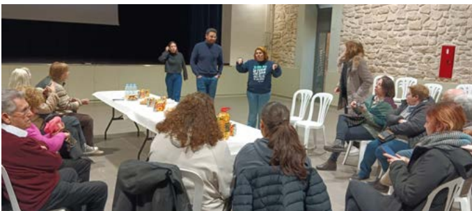
Cinefòrum de la pel·lícula "Figuras ocultas". Segrià Dinàmic. Març