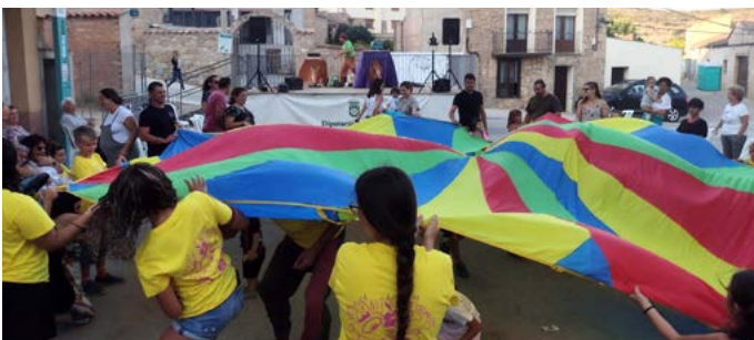
Animació Infantil. Festa Major Sant Salvador. Agost