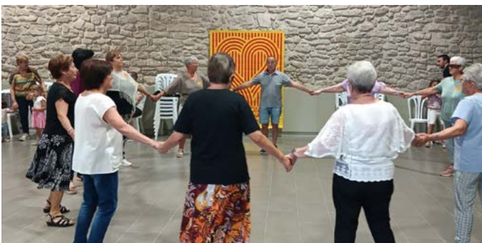
Ballada de sardanes per la Diada Nacional de Catalunya. Desembre