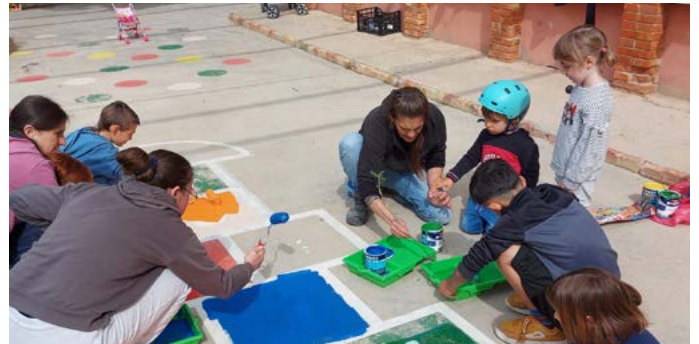
Pintem el pati de l'Escola. Abril