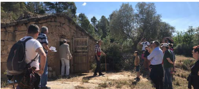
Ruta teatralitzada de la Pedra Seca. Juny