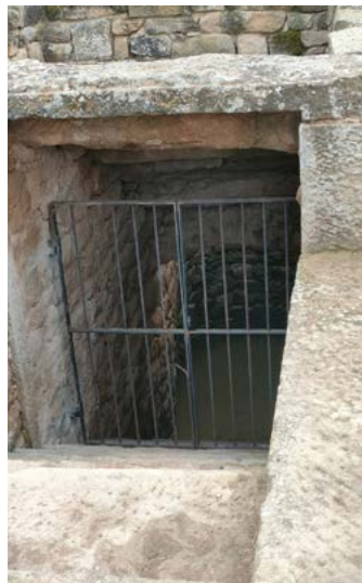
Dipòsit d'aigua de la vall

Com heu pogut comprovar, hem arranjat el safareig i el dipòsit d'aigua de baix de la vall, a través d'un ajut de la Diputació i un altre de la Conselleria de Cultura de la Generalitat de Catalunya. Aquest dipòsit s'emplena d'aigua del darrer pou d'aigua potable que va funcionar al poble mitjançant una bomba alimentada per una placa solar. En la mateixa actuació s'ha col·locat una porta a l'antic pou de la vila per garantir una major seguretat.