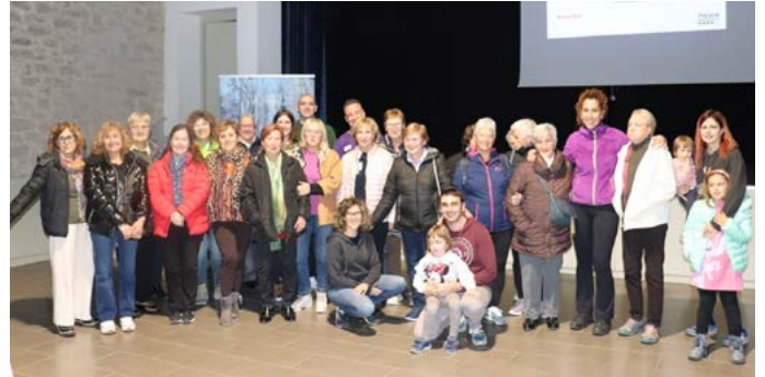
Taller d'autodefensa i prevenció de situacions de risc, Policia local de Sant Feliu de Llobregat. Novembre