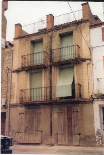
Imatge de la casa que va ser coneguda com cal Mestre i després cal Pau. Foto de l'any 2008, de l'autora.

En Francesc es va fent gran i vol contraure matrimoni, per aquest motiu ronda alguna noia del poble. Els pares compren una casa situada al carrer Major, en aquell temps carrer Sarroca, coneguda com cal Rabassa i la reconstrueixen totalment. Amb ells va ser coneguda com cal Mestre.