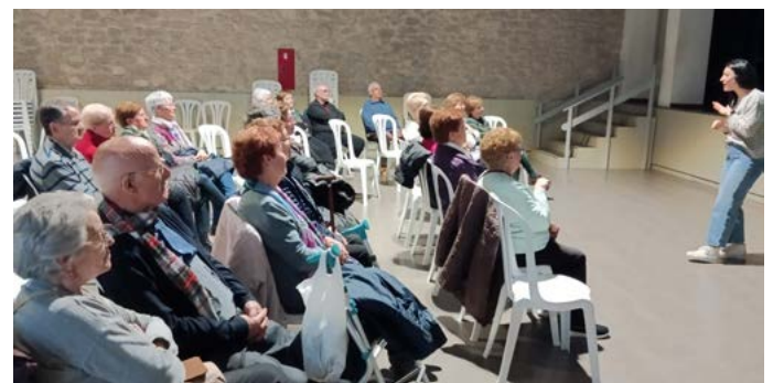
Taller d'estimulació cognitiva. Consell Comarcal del Segrià. Març