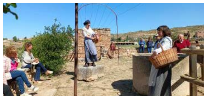
Primera ruta teatralitzada de l'oli i la pedra seca dins el Fòrum de l'Oli Verge Extra. Abril