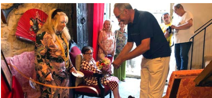
Inauguració de l'exposició de Ventalls a Cal Capó. Festa Major Sant Salvador. Agost