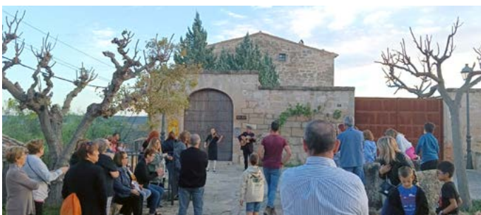
Jornades europees del patrimoni, amb Fratelli La Strada. Octubre