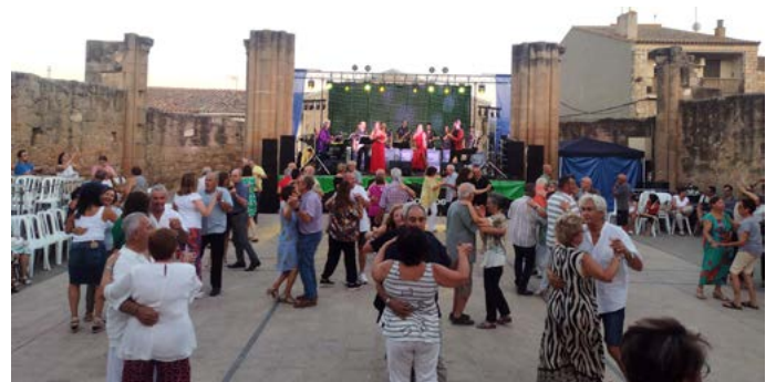
Ball de Festa Major. Festa Major Sant Salvador. Agost