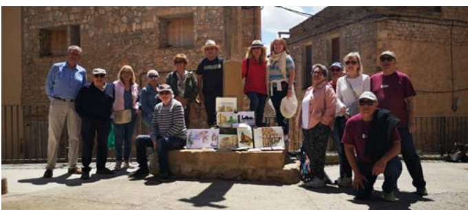
Urban Sketchers Lleida. Primavera Cultural. Maig