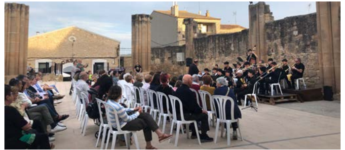
Concert amb la Big Band del conservatori de Lleida. Primavera Cultural. Maig