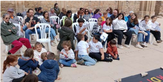
Activitat conjunta entre Escola i poble en motiu de la Diada de Sant Jordi: Lectura de poemes per part d'alumnes, mestres i veïns i veïnes. Abril