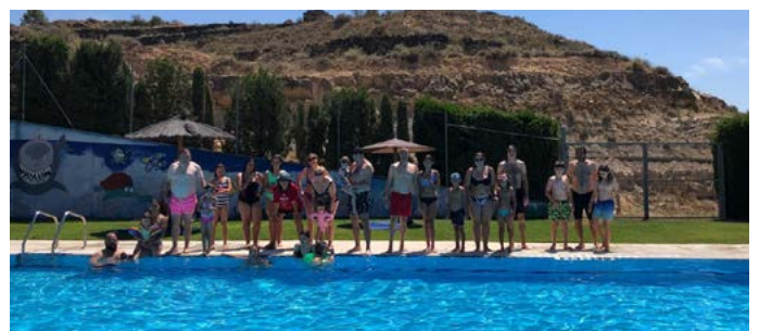
Mulla't per l'Esclerosi Múltiple. Juliol