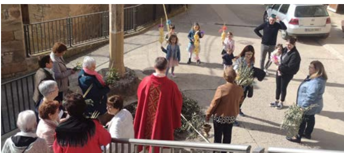
Diümenge de Rams. Març