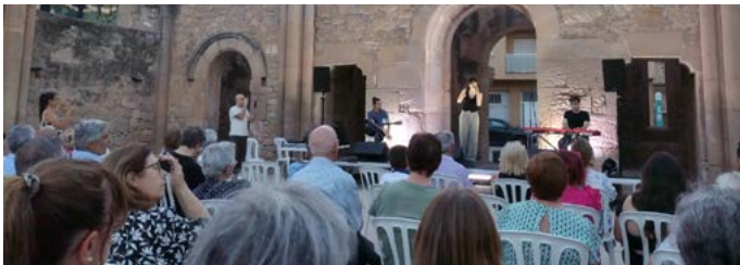
Escenaris singulars: Concert amb Bru Música. Juliol