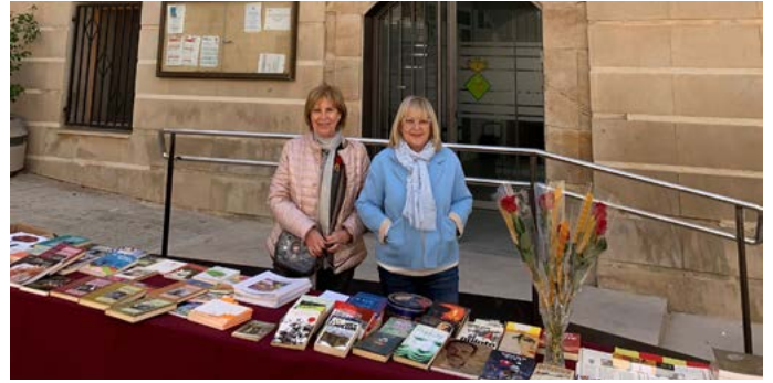
Venda de roses i llibres en motiu de la Diada de Sant Jordi. Abril