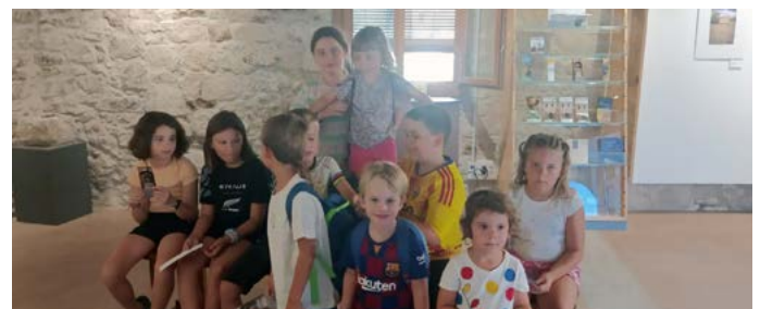
Visita del grup d'estades al CIPS. Juliol