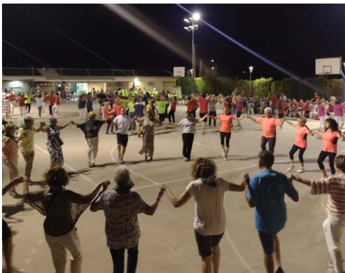
19a Volta Comarcal Sardanes a la fresca al Segrià, amb la cobla "11 de setembre". Juliol