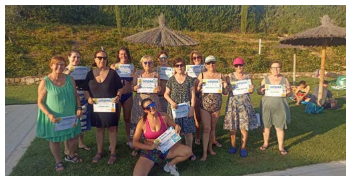
Cloenda de l'activitat d'Aquagym. Festa Major Sant Salvador. Agost