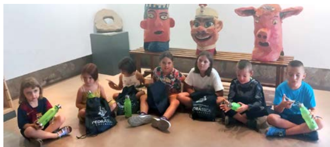
Gimcana d'orientació. Agost