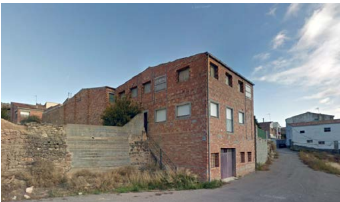
Antiga granja de Cal Marto

Dins dels ajuts que la Generalitat destina a les poblacions sota la zona d'influència de les Centrals Nuclears en previsió del seu tancament hem aconseguit, després de moltes negociacions i canvis per adaptar-nos a les bases de la convocatòria, que la Generalitat ens autoritzi fer un espai empresarial per poder ubicar-hi espais per a nous emprenedors, siguin del poble o de fora. També hi ha la possibilitat, després del seu arranament de dedicar-li una zona a possibles serveis com perruqueria, fisioteràpia, etc.