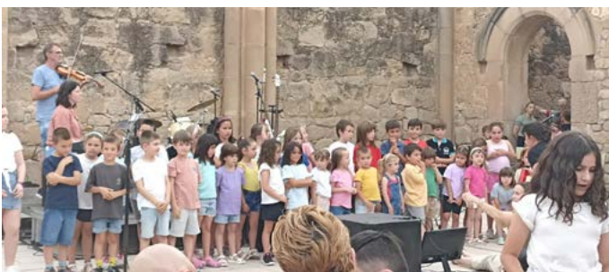
Actuació final de curs alumnes del CIM (Centre d'Iniciatives Musicals). Juny