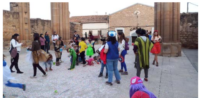
Carnaval i Festa de les Dones. Març