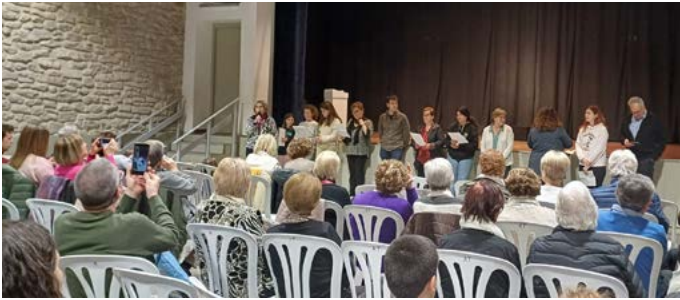
Lectura del manifest per l'eliminació de la violència de gènere. Novembre