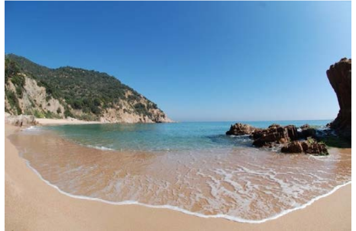
Platja de Santa Cristina d'Aro (Costa Brava)

De la zona on habitem el que més m'agrada és