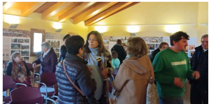
Presentació del Calendari 2025 de la Pedra Seca. Desembre