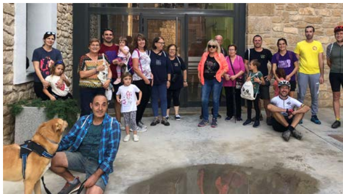
Setmana europea de la mobilitat: Caminada i bicicletada. Setembre