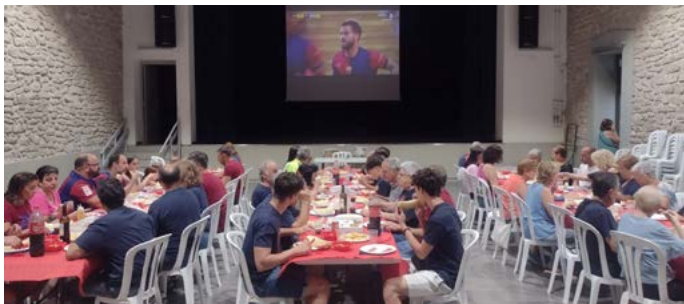
El trofeu Joan Gamper, amb la Penya Barcelonista. Agost