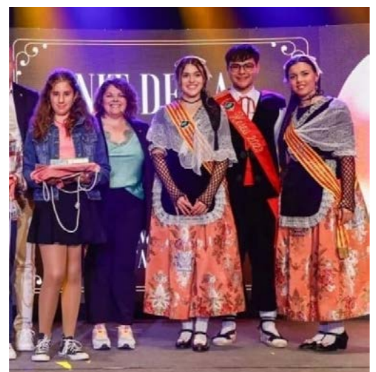
L'Alba rebent el premi en La Nit de la Cultura.