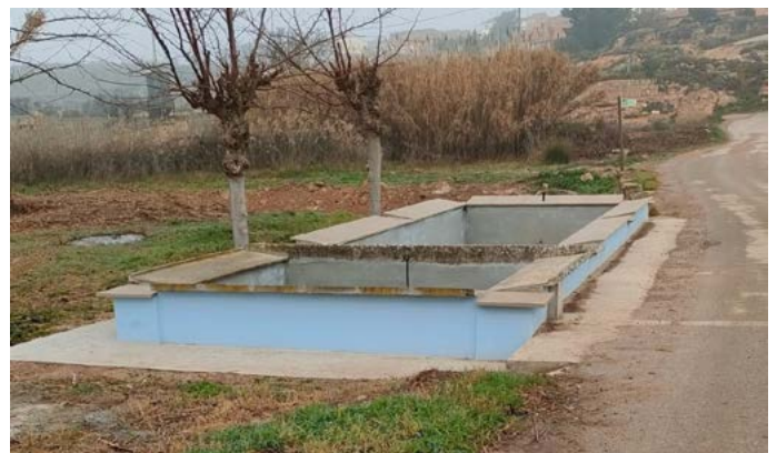
El safareig, recentment arranjat

Contacte: elbollodetorrebesses@gmail.com