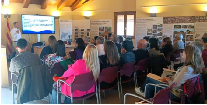
Gran assistència de públic al Fòrum de l'Oli. Abril