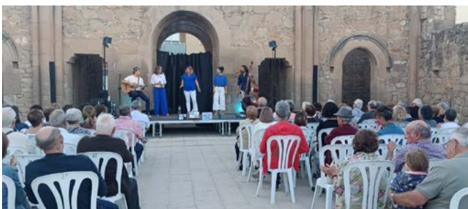
Cantada d'havaneres amb Les Anxovetes. Setembre