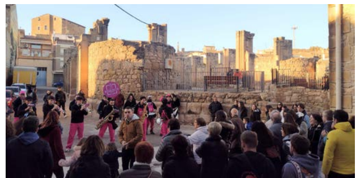
Txaranga Bsumeta. Festa Major Sant Sebastià. Gener