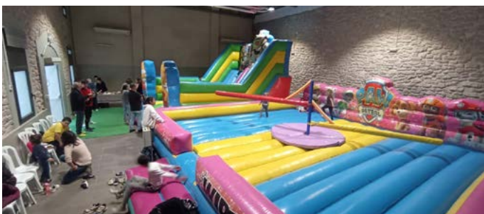
Castanyada AFA: Dolços, castanyes i inflables. Octubre