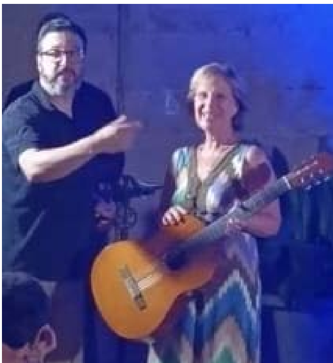
Església de Sant Salvador. Agost 2024

Dins d'aquest certamen, el poble acull tres concerts, que se celebren a l'església de Sant Salvador. L'assistència a tots els concerts et permet participar en el sorteig d'una guitarra. I el passat estiu, XIII edició, vaig tenir la sort que em va tocar la guitarra. Aquest fet, a part de la sorpresa i il·lusió del moment, em va evocar un record de la meva infància.