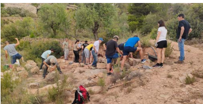
Curs de Pedra Seca a Torrebesses de la UdL. Juliol