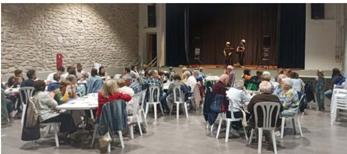
Bingo musical amb Les PaPiXules. Primavera Cultural. Maig