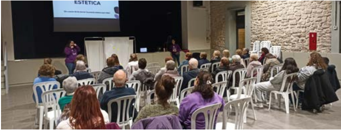
Xerrada a càrrec de l'Associació LIKA "Els cossos de les dones i la pressió estètica que reben". Novembre