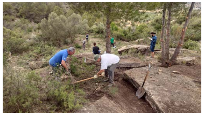
Voluntaris netejant la font i entorn de Sant Roc. Juny