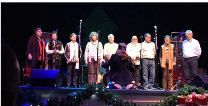
Coral de Torrebesses a Albatàrrec. Nadal Centre d'Iniciatives Musicals. Desembre