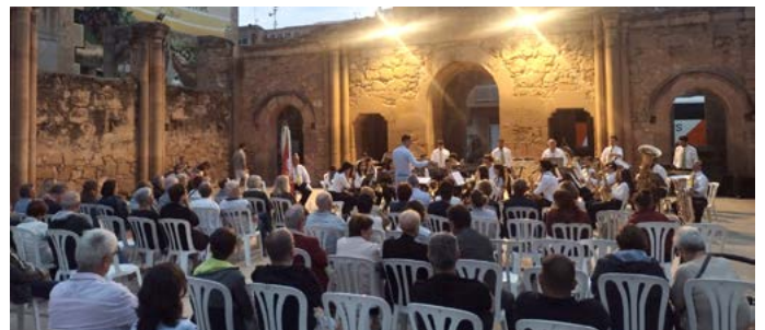
Fem Banda, Banda Filarmònica 1º de Janeiro. Juliol