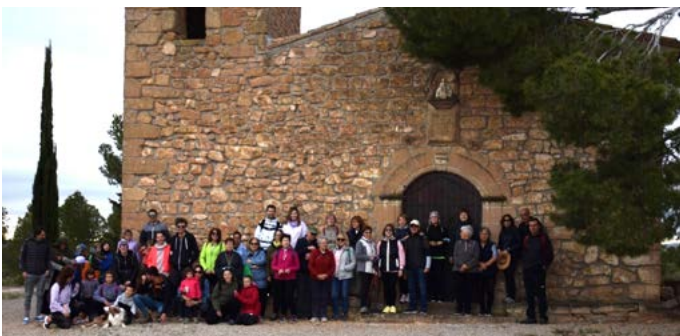
Caminada Popular. Primavera Cultural. Maig