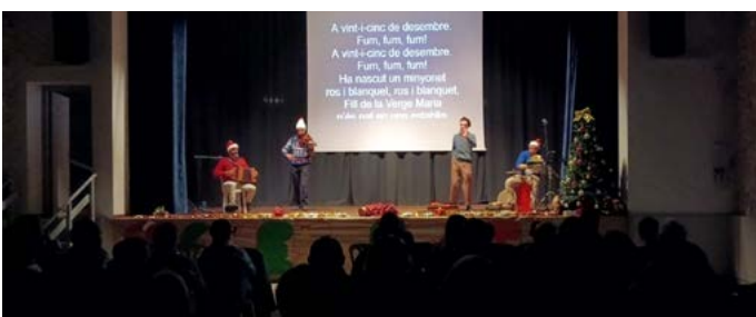
Torrebesses amb La Marató 3Cat. Espectacle Concert participatiu Desembre