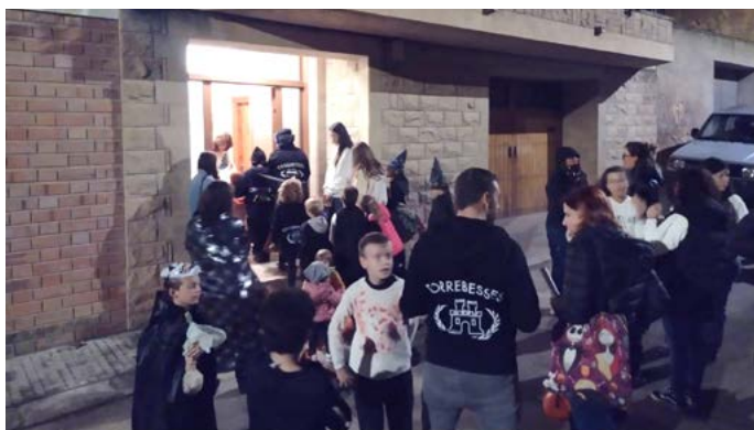
31 octubre: Vol de Bruixes i Bruixots.. Octubre