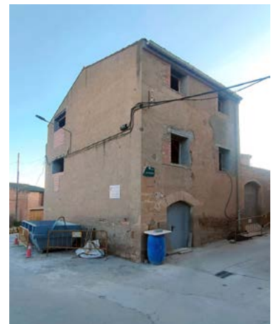
Ca la Regina

Una altra de les obres que estem portant a terme és l'arranjament de Ca la Regina, aquestes obres ens permetran disposar de dos habitatges per a lloguer, potser destinats a joves o per famílies. Aquestes obres són finançades pel Departament d'Habitatge de la Generalitat, que és qui marca les condicions per poder fer la licitació per l'adjudicació dels habitatges als usuaris. Des de l'Ajuntament intentarem que siguin les més favorables pels veïns de Torrebesses interessats en el lloguer.