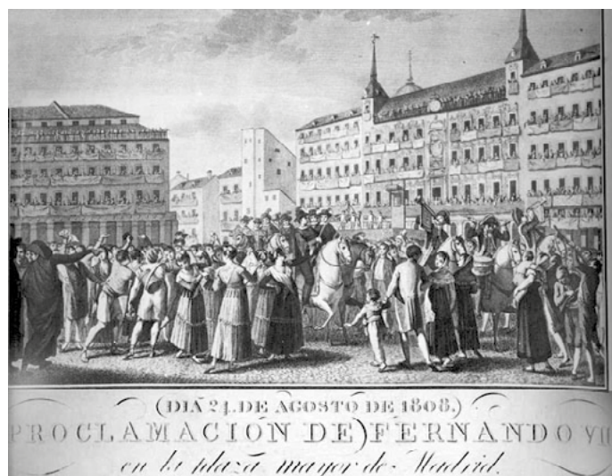
Proclamació de Ferran VII a Madrid.

Segons podem llegir al Glossari Català de Numismàtica , les medalles de proclamació “eren un complement de les festes de proclamació”, que es realitzaven des del s. XVIII per celebrar la pujada al tron d'un monarca. Tenien un aspecte similar a les monedes, i sovint hi apareixia el bust del rei, la data i ciutat de l'esdeveniment, acompanyades de referències a la fidelitat d'una ciutat al monarca, i al·legories a les seves gràcies i bondats. Eren, doncs, un element propagandístic de primer ordre, com també ho eren (i ho continuen sent) les monedes. A més, complien una altra funció també prou evident. El rei de torn, a més d'obsequiar-les a les autoritats, també les llençava al “populatxo”. En algunes ocasions, com veurem tot seguit, aquestes medalles eren fetes de plata. El fet, doncs, de llençar unes medalles fetes d'un metall noble sobre la multitud, assegurava una rebuda pacífica, i també una concorreguda presència de la gent davant la comitiva reial.