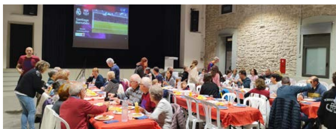
El Clàssic amb la Penya Barcelonista Torrebesses. Octubre