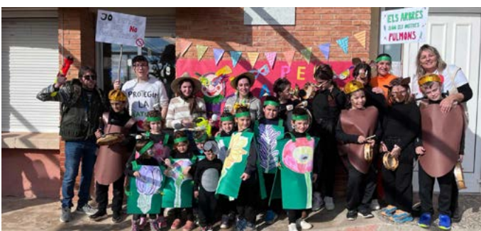
Carnaval a l'Escola. Febrer