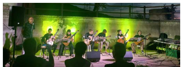
Ruta d'oli i guitarra - III Campus Pujol. Concert al Molí del Bep de Canut dels músics participants. Juliol